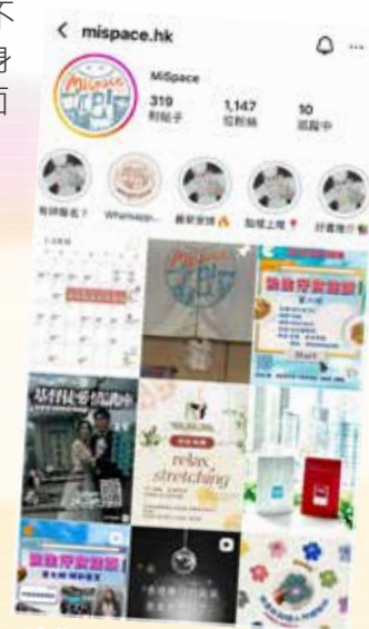
● MiSpace IG