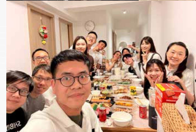
●不同分區的青年同心為福音