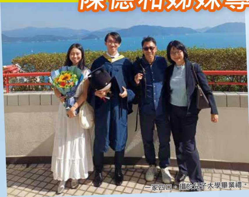
一家四口，攝於兒子大學畢業禮。