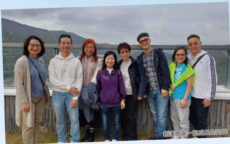
新蒲崗區一起成長的同伴

基督徒與世人一樣，同樣面對疾病死亡，但可倚靠神，坦然交託，人生就不一樣。病人的名字，很快被遺忘；信主之人的名字，卻記在生命冊上，蒙神記念。故此，人生的價值不在於地上的名利就，而在於是否連於這位造物主。