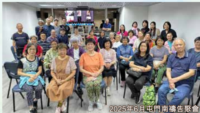
2025年6月屯門南禱告聚會

為著福音開展，弟兄姊妹積極籌備。七月中，一班兒童、中壯年及年長聖徒出外佈道，在街頭獻詩、派單張。雖然人人大汗淋漓，但無減內心的福音負擔與熱情，由兩歲小孩至退休肢體，大家同心合意興旺福音。