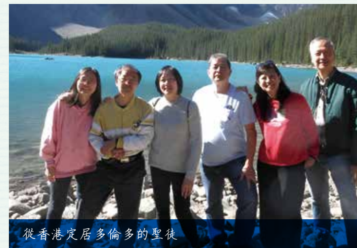
從香港定居多倫多的聖徒

做不成經紀，只好找其他工作，但面試時對方看了我的履歷，說：「關先生，你有豐富經驗，我們不能聘請你了。」無工可做，怎麼辦呢？有天看見