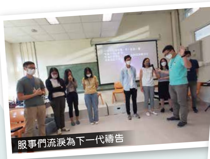
服事們流淚為下一代禱告