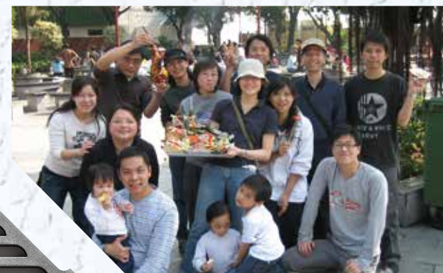
2005年荃灣區少年服事

我在渠務署工作，經過此事，發現自己最大的恩賜就是通渠，所以我稱自己為「通渠執事」。恩賜各有不同，只要我們願意擺上，神都用得著呢！ 家