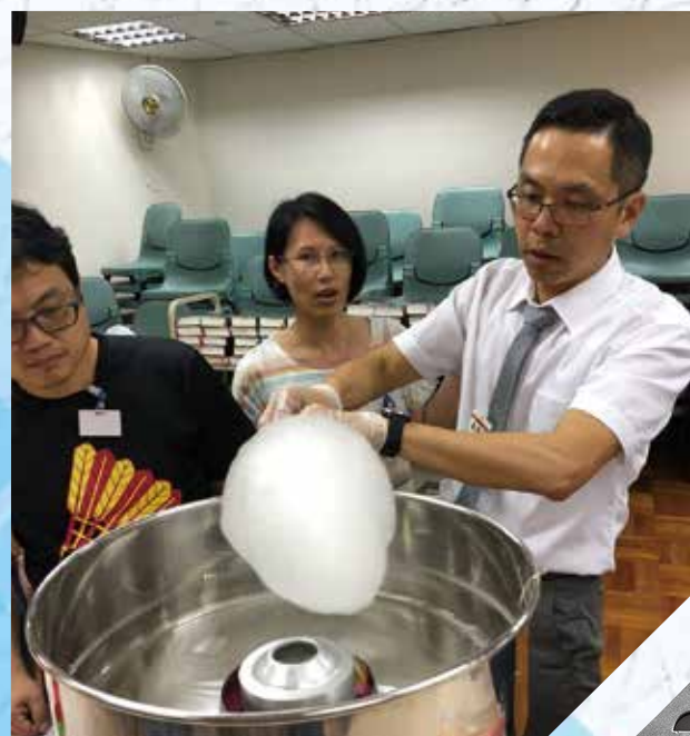
2018年葵涌區嘉年華攤位，製作棉花糖。

第二，入營時很多東西都沒有帶備，看似很缺乏，但仍可繼續生活。原來生活可以很簡單，許多事物都可以放下，為甚麼還要執著呢？