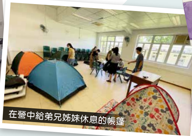
在營中給弟兄姊妹休息的帳篷