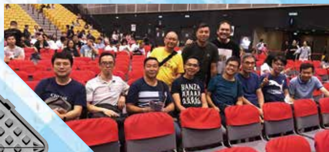
2019年肢體相交小組參加讚美之泉音樂會

另一方面，經妻子的提點，我會反省自己是否只注意工作和服事，而忽略了家庭，甚至冷落了她。當我自覺虧欠，就要將注意力放回家庭，不能讓妻子獨力承擔所有擔子。主給我的功課，是要好好照顧自己的家庭，因為「人若不知道管理自己的家，焉能照管神的教會呢？」(提前三5)願我不但做好執事的本分，也要做好丈夫和父親的本分。