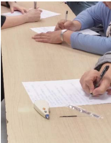
不少中壯年弟兄姊妹背默整段經文