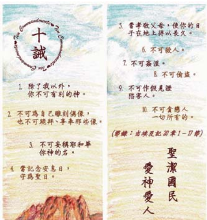
獎品：設計精美的十誡書籤