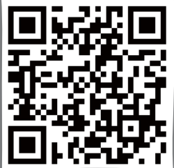
網上版家訊及 主日信息詳細版

是次背經活動已圓滿結束，參與者皆獲精美的十誡書籤以作獎勵。盼望每位聖徒日後仍能存著這般鄭重、愛慕主話的心，更加渴望、期待其餘誡命的信息分享，同時將主的話刻在心板上，惟願得主更大的讚賞。