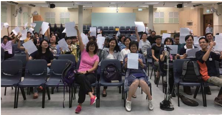
聚會後弟兄姊妹踴躍參與背經

問到各人參與背經的原因，弟兄姊妹異口同聲表示，是要鄭重地領受主的吩咐。有聖徒指出，十誡是神頒佈給以色列人的標準，亦是對我們的命令，理當受到重視。亦有兄姊說，背經的動機不是展示自己的聰明才智，或想要贏取別人的讚許，而是要把記性用在正確的事情——謹記主的教訓。主說：「…就是到天地都廢去了，律法的一點一畫也不能廢去，都要成全。」(太五18)一點一畫都是從神所出的，我們應懷著敬畏、莊重的心，銘記主每句寶貴的教訓。