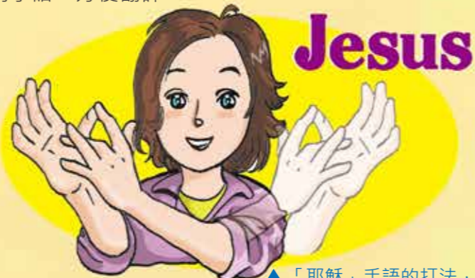
▲「耶穌」手語的打法，這手語聯想於主釘痕的手。

要翻譯聖經人物，我們會以人物生平的顯著事跡作為他的手語名，例如大衛便以「右手扔出小石」的動作來表達。近年有機構制定一些聖經專門手語，方便翻譯。