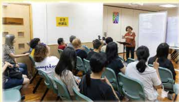
▲主日擘餅聚會的手語翻譯區

手語翻譯服事，是藉手語讓失聰聖徒接收信息，與聖徒們一同聚會。現時葵涌區設有聚會手語翻譯，今次家訊訪問了該區的手語翻譯服事，帶大家走到聚會一角的手語翻譯區！