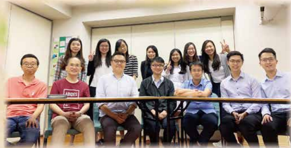
▲先知書組弟兄姊妹合照

每當讀到神對祂子民的愛時，我都會感到很希奇。雖然書中的審判信息較多，但當中對神愛的刻畫卻跟何西阿書有異曲同工之妙，叫人不能不感動。書中提到以色列人多次行淫，忘記了自己的丈夫，從人來看，只會唾棄、離棄這淫婦，神卻顧念與他們的婚約，竟然接納行淫的以色列，仍不斷呼喚以色列人悔改，神愛的長闊高深真是非筆墨所能形容！令我難忘的是，即便是宣告審判列國的信息，字裡行間仍不斷滲入對他們的拯救和安慰——神就是顧念他們，要向他們宣告救贖的計劃。神的愛就是永遠的、不變的、無條件的，巴望神不斷用愛來吸引我們，使我們一生都折服在神愛底下。(珊)