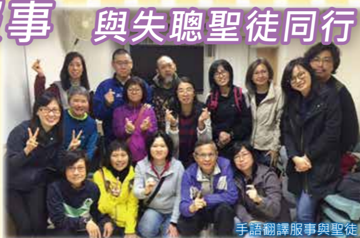
手語翻譯服事與聖徒