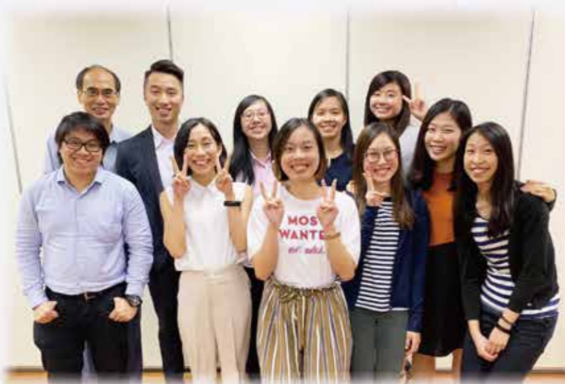
◀歷史書組弟兄姊妹合照

造，願意捨己地服事，甚至直到死地；因著他完全奉獻的心，主不斷磨煉他成為堅牆，這提醒我反思自己是否完全甘心樂意地服事。我曾聽過一位弟兄說，為主背十字架就是去到死的地步，若今天服事的態度是為著安舒，求神更多責備我們。