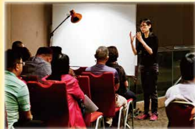
▲新春佈道會手語翻譯區，白板寫著「放負，負=負面思想」。